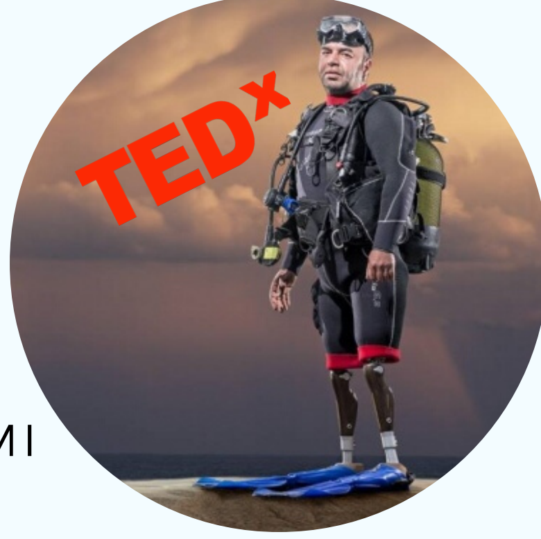
UFUK KOÇAK Dünya Serbest Dalış Rekortmeni SI-NIR-SIZ KİTABININ YAZARI